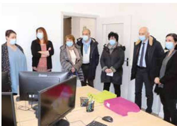
Les nouveaux locaux visités par nos élus.

L'INSE travaille à la mise en accessibilité de l'espace pour les PMR dans les meilleurs délais, en attendant elles seront reçues dans les locaux du CCAS.