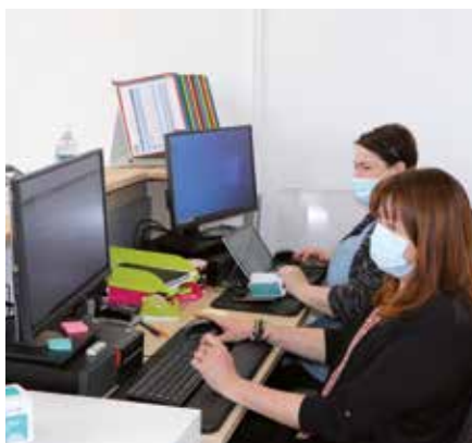
Les agents France Service.

Au-delà de ce socle de services garantis, l'espace France services de Verneuil vous permet de rencontrer les partenaires qui intervenaient au Point d'Accès aux Droits. Les services offerts pourront d'ailleurs s'enrichir en continu.