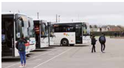
Le parking actuel à la sécurité limitée.

Le parking situé entre le lycée et la piscine est fréquenté, surtout pendant les périodes scolaires, par de très nombreux lycéens, qui y circulent à pied, qui y sont déposés par des voitures ou un grand nombre de cars scolaires et tout cela dans le plus grand désordre. Leur sécurité est loin d'être assurée, c'est pourquoi la commune a souhaité y créer une vraie gare routière. Ce parking étant propriété de la commune, elle en sera le maître d'ouvrage, mais compte tenu de sa fonction de parking « du lycée », donc accueillant des élèves qui ne sont pas que verneuliens, la commune a demandé à la Région, gestionnaire du lycée, et à la communauté de communes de participer au financement. Le projet a été inscrit au contrat de territoire. Les travaux commenceront mi-juin