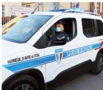
Le nouveau véhicule déjà en service pour une nouvelle patrouille.

L'effectif de la Police Municipale, 7 agents, nécessitait un second véhicule afin que l'ensemble du territoire de la commune nouvelle puisse être régulièrement parcouru. Un nouveau véhicule est à la disposition des agents depuis le début de l'année. Afin d'assurer une sécurité maximale à l'ensemble des usagers de la route et notamment les piétons, des structures visant à ralentir la vitesse