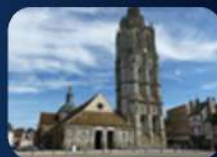
PLACE DE LA MADELEINE