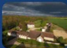
LA FERME DES MOULINS