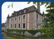
CHÂTEAU DE L'ÉCUREUIL