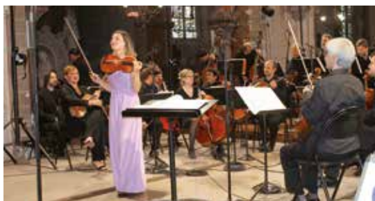
Festival Eure Poétique et Musicale

Les animations c'est aussi des fêtes populaires comme la Fête du Printemps, la Fête des Gueux et les très nombreuses fêtes des voisins organisées dans les quartiers de Verneuil.