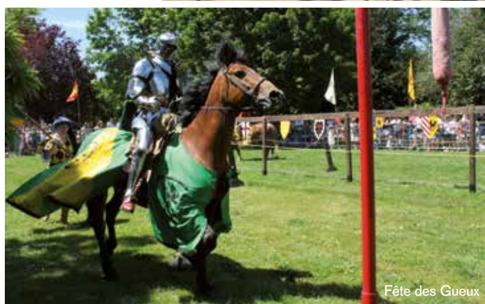
Fête des Gueux