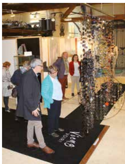
Exposition Edith Delattre "Viens voir !"