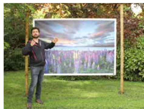
Exposition Nicolas Orillard-Demaire